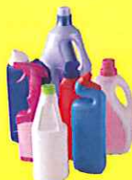
Flacons de produits d'entretien (produit vaisselle, eau de javel, adoucissant...)