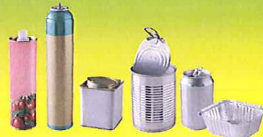
Bouteilles métalliques (sirop), boîtes de conserve, barquettes aluminium, canettes, tous les aérosols bien vidés...