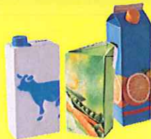
Toutes les briques alimentaires (lait, jus de fruits...) vidées et écrasées.

Attention : Pas de film plastique enveloppant les publicités.