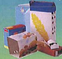
Les petits cartons (paquets de céréales, boîtes à œufs, paquets de gâteaux) pliés (sans films et barquettes plastiques).

Attention : Pas de film plastique enveloppant les publicités.