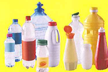
Bouteilles alimentaires avec bouchons (eau, jus de fruits, lait, huile, ketchup...)